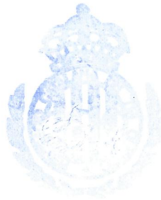
Signat: Josep Bartomeus Àrbitre